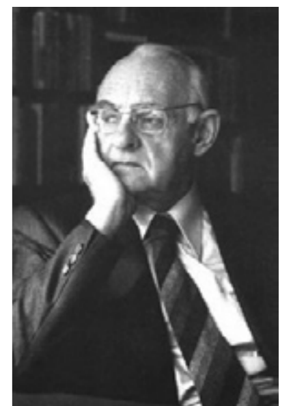
► Hans Urs von Balthasar

sto è il presupposto per riconoscere l'uomo in quanto uomo e vivere come tale. Per Bultmann ciò avviene - cioè che l'uomo sia uomo in quanto uomo - quando l'essere umano si decide per Dio, dice sì a Dio. Solo dopo questo atto di libertà egli non si colloca più in mezzo alle cose, ma si riqualifica nell'orizzonte di Dio. In Bultmann l'atto di fede ha una portata escatologica, costituisce cioè l'apice della storia dell'uomo come singolarità insuperabile, come persona, ovvero corrisponde all'irruzione del Regno di Dio nella storia dell'umanità. Non c'è un futuro di redenzione lontano, ma il futuro impossibile della salvezza sta già tutto qui, nella decisione di fede, nel libero sì che ciascun essere umano, in modo unico e irripetibile, pronuncia nei confronti di Dio. Per Balthasar tutto ciò è possibile non semplicemente a partire dalle potenzialità umane e per esclusiva iniziativa personale, ma solo a partire dalla manifestazione della gloria di Dio, in tutto il suo fulgore, in tutta la sua bellezza: in tutto quell'uomo Gesù, in tutto quel Dio crocifisso che muore d'amore. In questo senso la bellezza che rifulge da un dono d'amore gratuito, costituisce la risorsa ultima di difesa e custodia della libertà dell'uomo, da ogni meccanismo antico e moderno che intende mortificarla, monetizzarla, appiattirla, cancellarla. ■