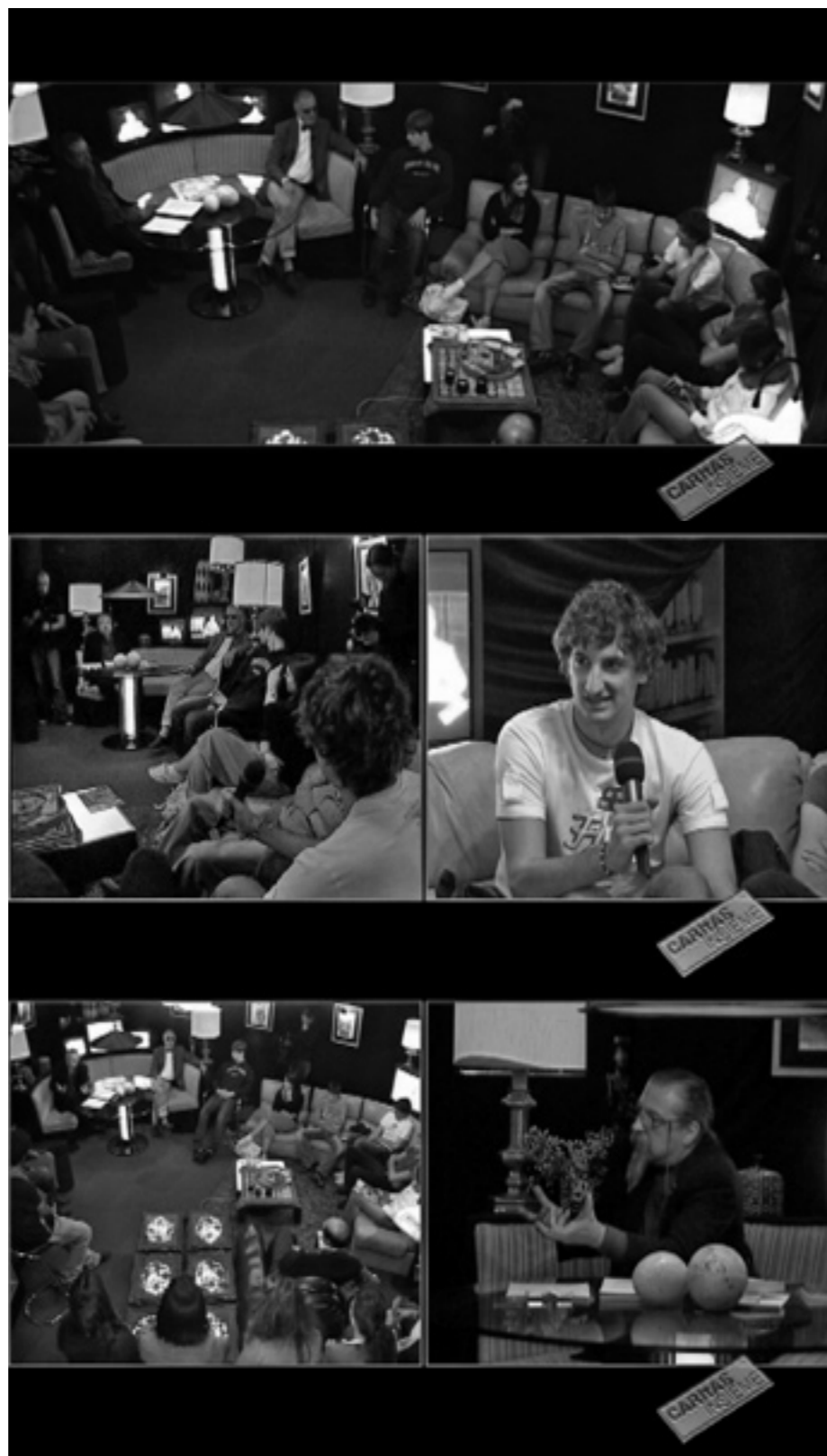
► Una classe del terzo corso del Centro professionale commercio di Chiasso, nel Sigrid Undset Club di Caritas Ticino il 16 ottobre 2009 in onda a Caritas Insieme TV il 25 ottobre 2009 e online su www.caritas-ticino.ch

Eppure, i poveri ci sono anche oggi. Allora come spiegare questo apparente paradosso? La povertà di oggi, non è legata alla scarsità di risorse, ma alla scarsità delle istituzioni economiche, economiche e giuridiche. Questo è il punto: se oggi c'è gente che muore di fame, non è perché manchi il riso,