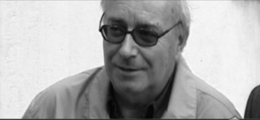
► Don Giuseppe Bentivoglio, in onda su Caritas Insieme TV il 27 settembre 2009, online su www.caritas-ticino.ch