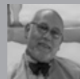
SUL LITORALE, IL VOLO... di Graziano Martignoni