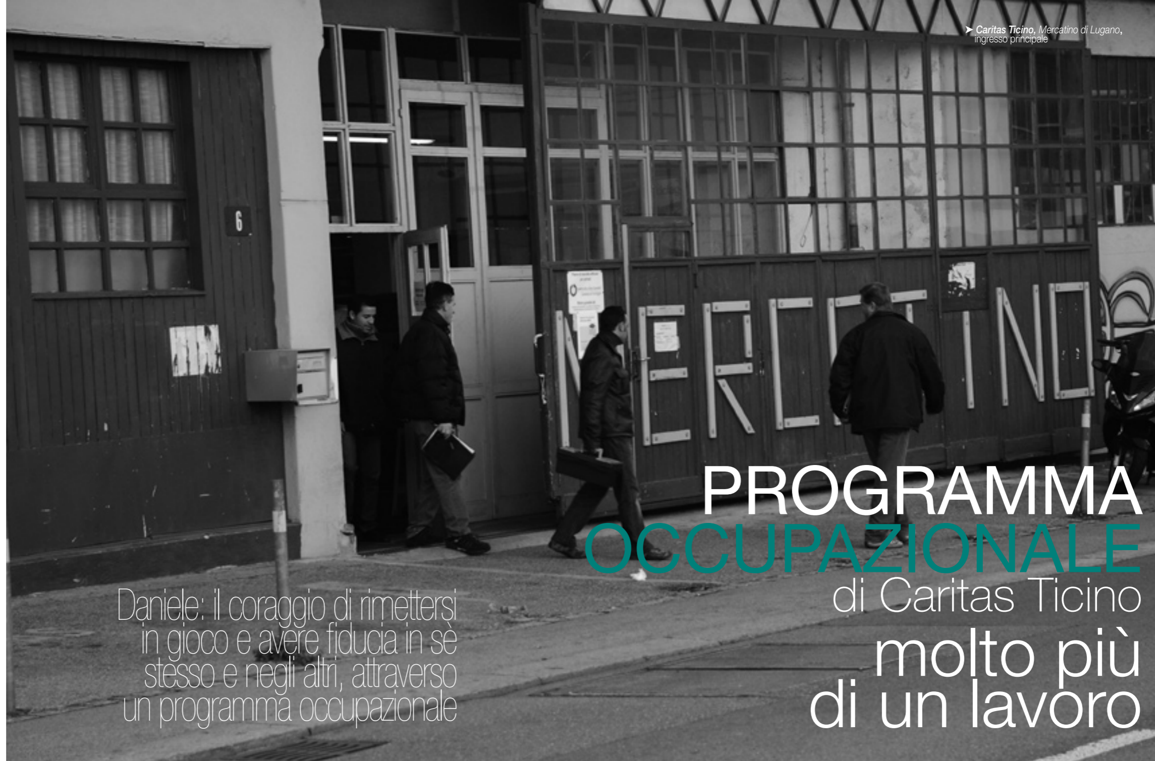
Caritas Ticino, Mercatino di Lugano, ingresso principale

Lo stesso beneficio che traggio io sotto il profilo morale e che mi ridà fiducia verso il futuro...”.